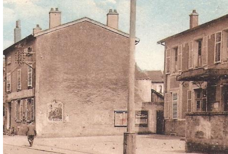
n° 17 :