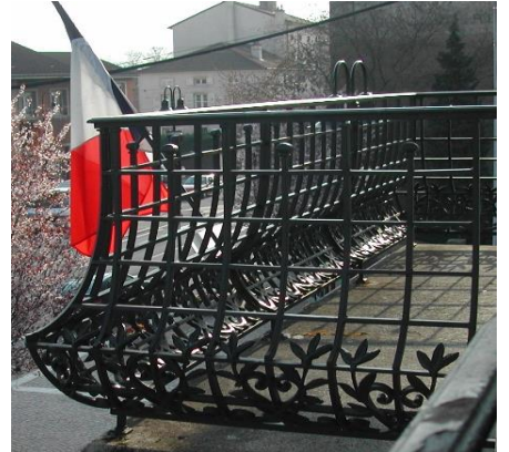
n° 18 :