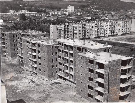
n° 16 :