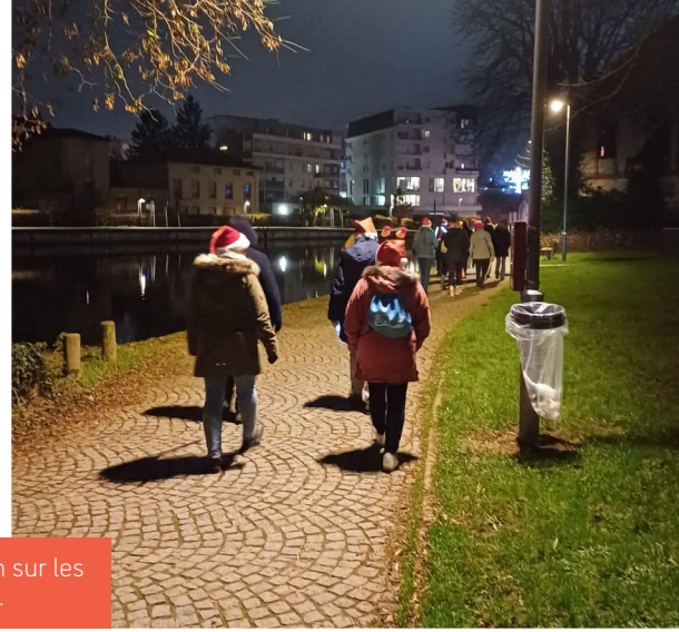
La Marche de Noël : La soixantaine de participants au bonnet rouge : parcouru environ 3 km sur les bords de Meurthe. Au retour, les marcheurs ont partagé une bonne soupe et des viennoiseries.