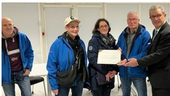
Bravo à l'ARSEM pour sa dynamique et ses succès !