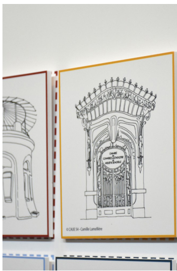
Exposition Archirama - CAUE - www.caue54.fr

Ces rendez-vous vous permettront d'en savoir plus sur ce mouvement artistique apparu dans les années 1910 et ayant connu son plein épanouissement dans les années 1920.