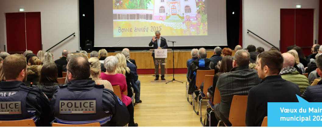
Vœux du Maire au personnel municipal 2025 le 8 janvier 2025