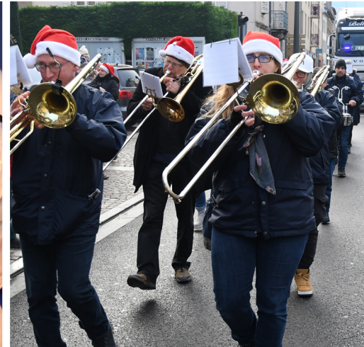
Défilé de la Saint-Nicolas le dimanche 8 décembre 2024