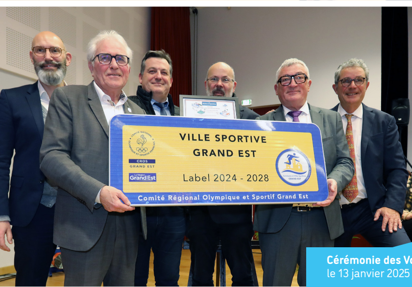
Cérémonie des Vœux 2025 le 13 janvier 2025