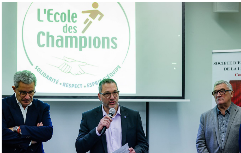
École des Champions – 11 décembre 2024 : Au Centre Sportif Henri Cochet, 80 enfants issus de l'accueil de loisirs, du Pôle Jeunesse, de C'Noue, du club de basket, de GR Academy et des villes voisines (Malzéville, Pulnoy, Saulxures, etc.) ont participé à divers ateliers sportifs et ludiques. Prochaine sélection : juin 2025 au Centre Social Saint-Michel Jéricho