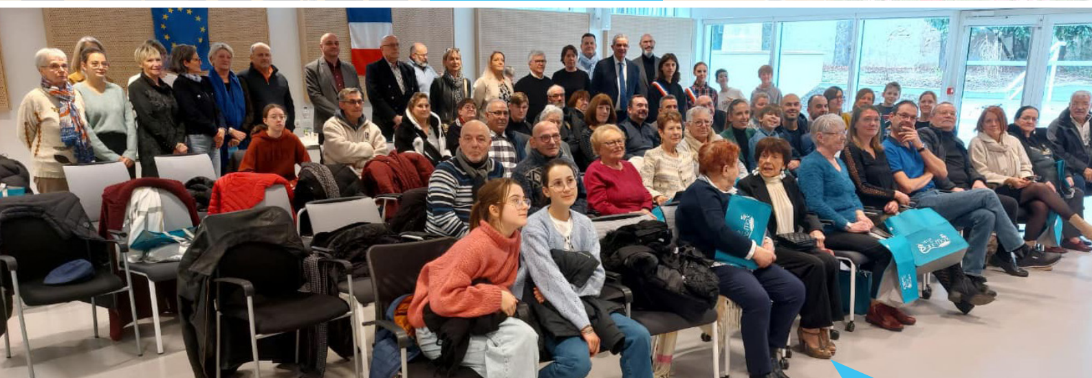
Remise des prix au concours des maisons et balcons décorés 2024 le 18 janvier 2025