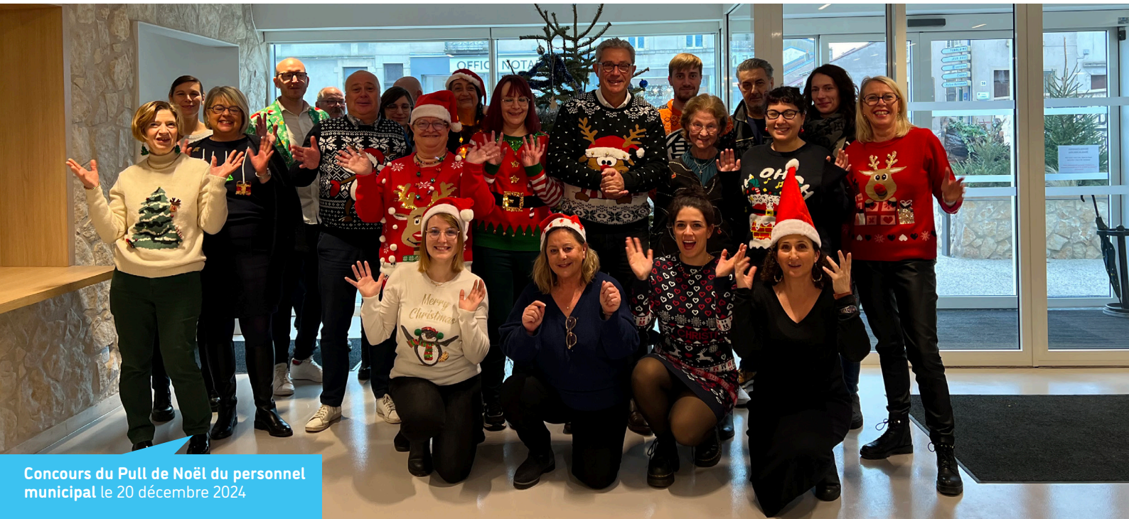
Concours du Pull de Noël du personnel municipal le 20 décembre 2024