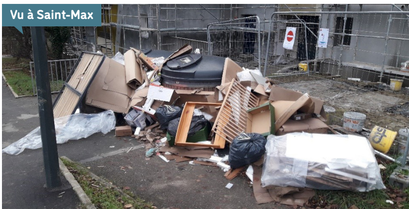
Vu à Saint-Max

Depuis plusieurs semaines, les services techniques de la Ville de Saint-Max constatent une recrudescence des dépôts sauvages d'objets encombrants sur les trottoirs. Ces actes d'incivilité nuisent non seulement à l'esthétique de nos rues, mais également à la qualité de vie de tous les Maxois.